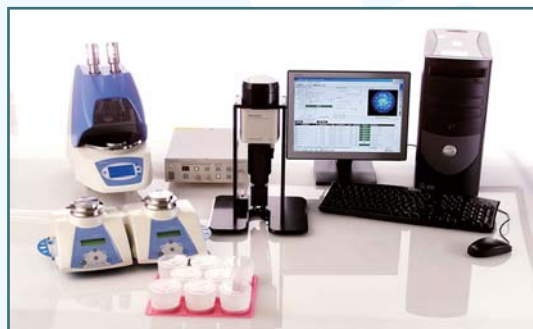
Milliflex Rapid System