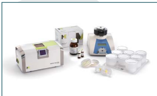
Milliflex Quantum System

可方便的升级成为 Milliflex Quantum 或 Milliflex Rapid 快速检测系统，满足客户在快速检验方面日益增长的要求。